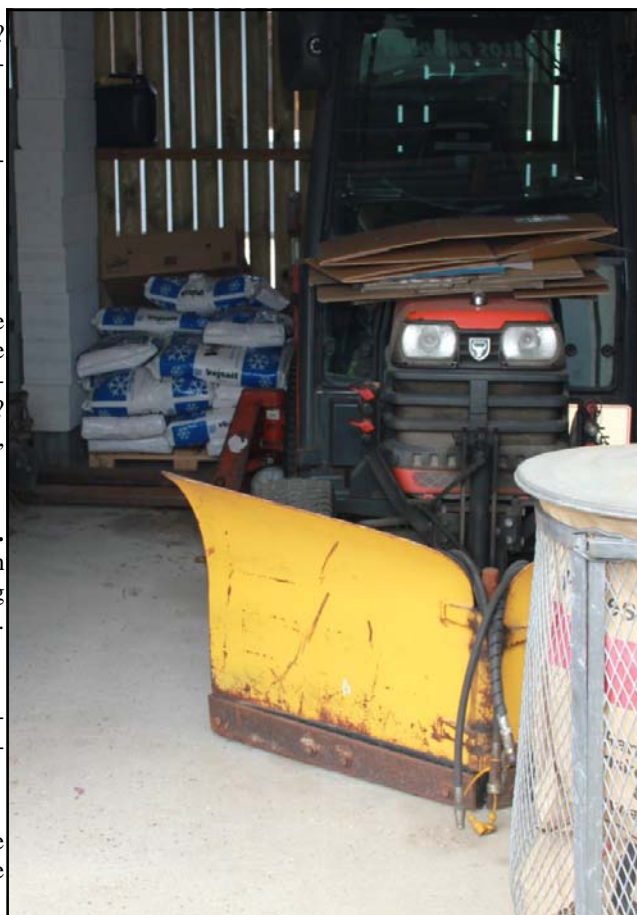
Sneploven vi fik fremvist i maj 2010 i garagen med tø-salt klar i sækkene