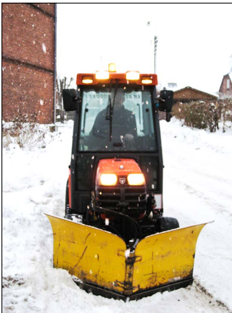
Sneploven i fuld funktion i Langå den 12. december 2010