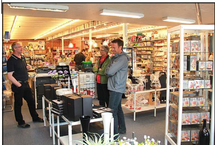
Et kig ned igennem fra Isenkram til Posten i baggrunden. Længst til højre anes bogafdelingen.